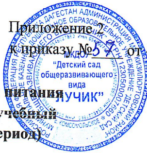
График выдачи питания на 2024 – 2025 учебный (холодный период)

Приложение 2 к приказу № 9 от «25» 08 2024